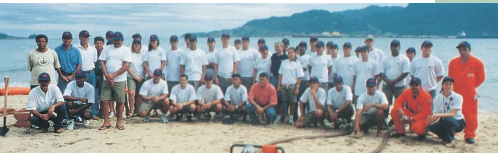
Participantes da primeira turma: interesse na preservação da Ilha.

O curso contou com aulas práticas e teóricas para os presentes.